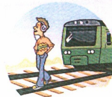
Слушать плеер и говорить по телефону вблизи железной дороги.