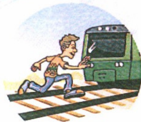
Перебегать пути перед поездом.

Слушать плеер и говорить по телефону, т. к. можно не услышать сигналы приближающегося поезда и объявления диктора.